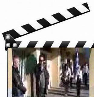
Ομιλία Δ/ντή 11 ου Δ.Σ. Αθηνών

Τέλος , πραγματοποιήθηκε από τους ορισθέντες σημαιοφόρους και παραστάτες των δύο σχολείων , η καθιερωμένη παρέλαση στον προαύλιο χώρο του σχολικού μας συγκροτήματος και στη συνέχεια η γιορτή μεταφέρθηκε μέσα στις σχολικές αίθουσες .