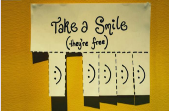
«Λορέν Χαμόγελο»: Πιάσε μολύβι καλά! Κάνε πολλά! Πάρε ένα! Δόσε σε καθένα!!!