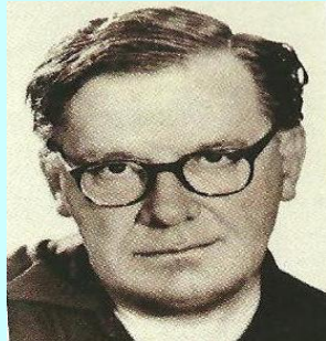
Νίκος Εγγονόπουλος (1907-1985)