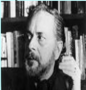
Γιάννης Ρίτσος (1909-1990)

Για άλλους, μόνο η 21 η Μαρτίου είναι η Παγκόσμια Ημέρα Ποίησης και Ποιητών ... Για εμάς, η κάθε μέρα μπορεί να είναι ποιητική -με βαθιές σκέψεις, επικοινωνία και δημιουργικότητα- αφού ζούμε, μαθαίνουμε και αγωνιζόμαστε για τη ζωή κάτω από τα αθάνατα βλέμματά τους.